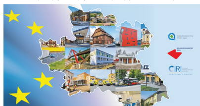
Dotace EU v Královéhradeckém kraji | 2014–2020 Čerpání evropských dotací za programové období a přehled projektů Královéhradeckého kraje

Grafická publikace „Dotace EU v KHK 2014–2020“ ke stažení ZDE