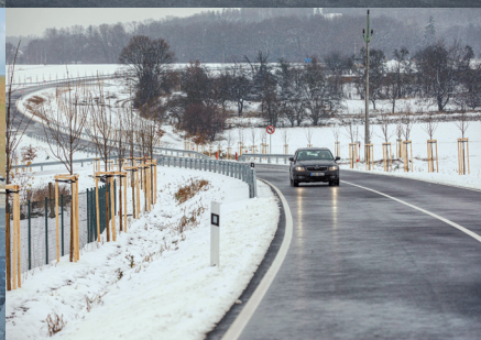
II/321 Černikovice – Domašín, obchvat