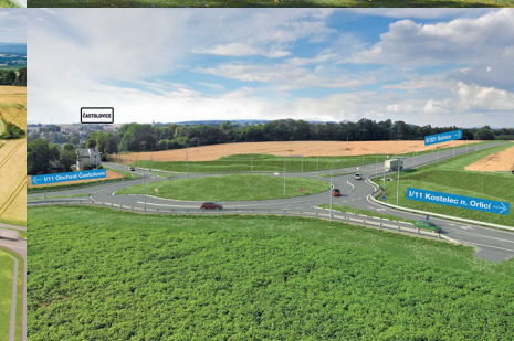
Častolovice – východní obchvat

Situace širších vztahů průmyslové zóny Solnice – Kvasiny