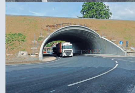
Nové Město nad Metují – Krčín