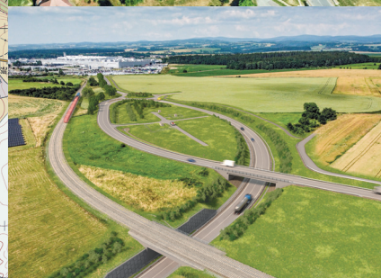
PZ Solnice – Kvasiny pro budoucí investory