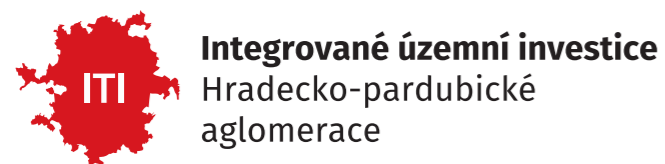
Poloha Hradecko-pardubické aglomerace v Královéhradeckém a Pardubickém kraji

Celé území aglomerace je podporovatelné z evropských fondů na základě strategie integrované územní investice (ITI).