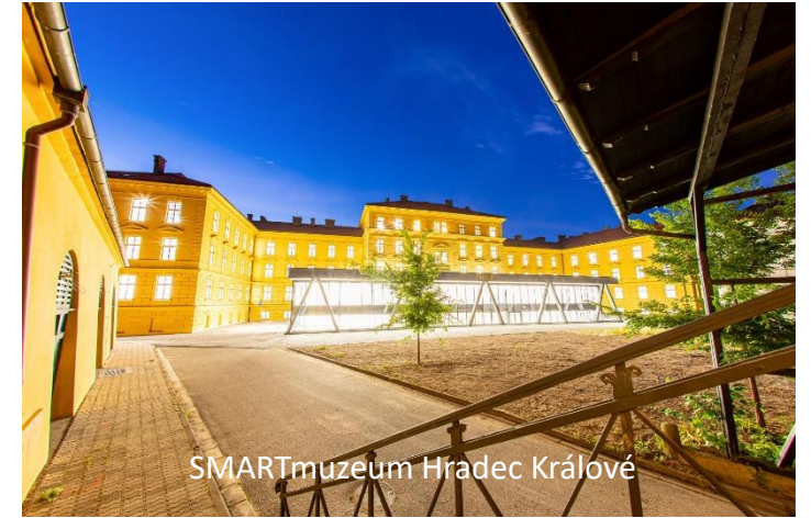
SMARTmuzeum Hradec Králové