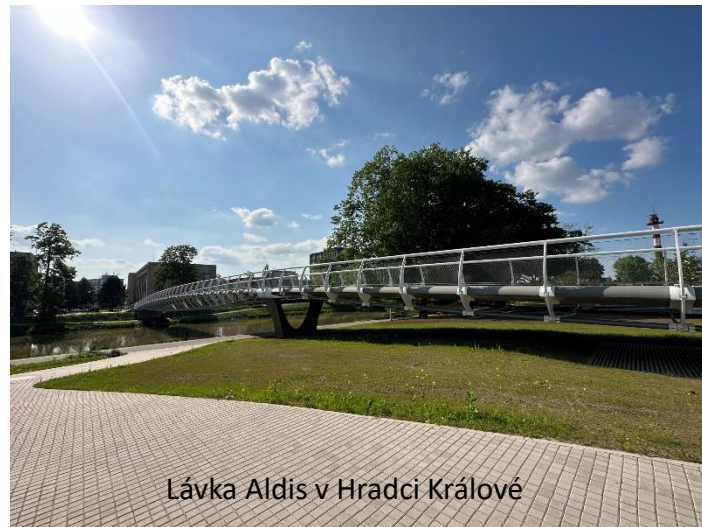
Lávka Aldis v Hradci Králové