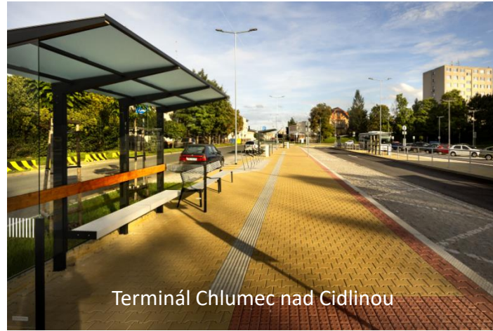
Terminál Chlumeč nad Cidlinou