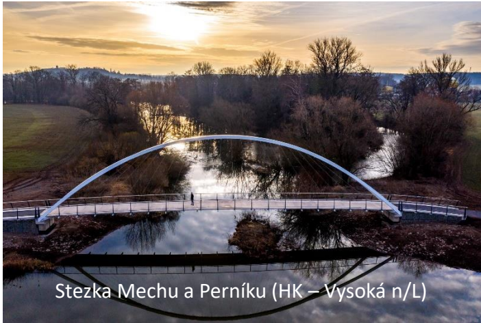
Stezka Mechu a Perníku (HK – Vysoká n/L)