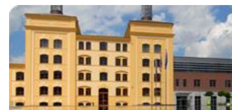
MIMOŘÁDNÉ ÚČELOVÉ PŘÍSPĚVKY