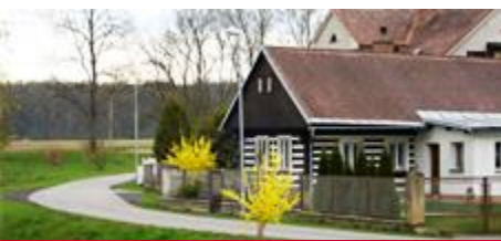
PROGRAM OBNOVY VENKOVA