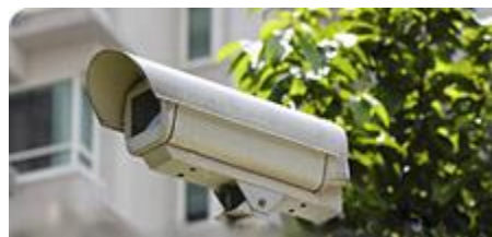
PREVENCE RIZIKOVÉHO CHOVÁNÍ