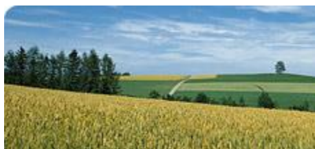
ŽIVOTNÍ PROSTŘEDÍ A ZEMĚDĚLSTVÍ