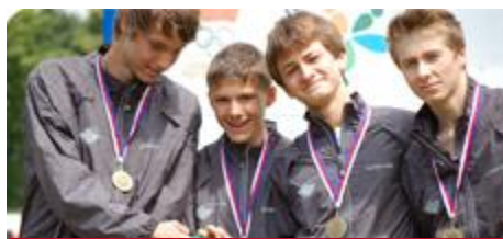
SPORT A TĚLOVÝCHOVA