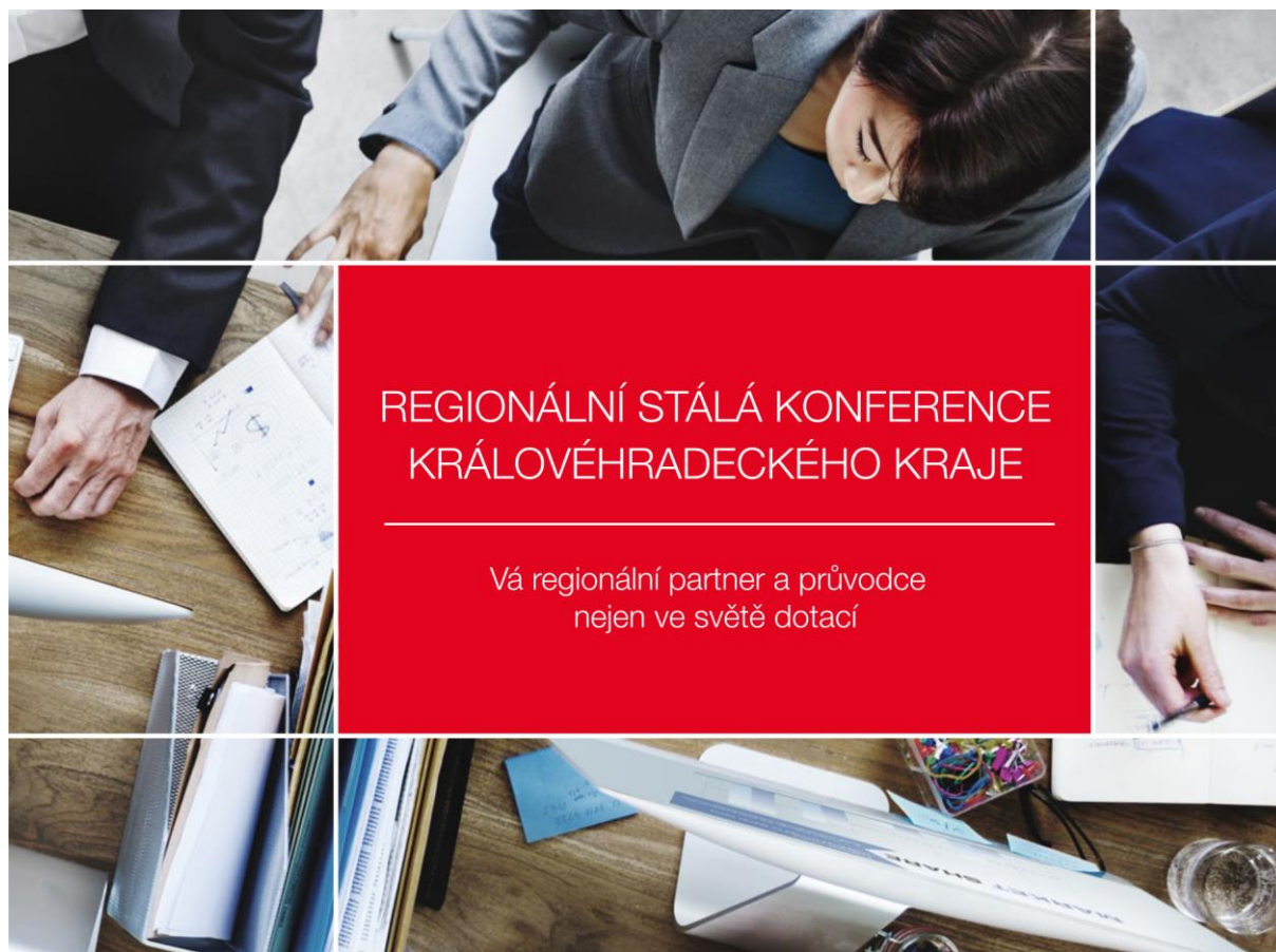
Obr. 13 Brožura RSK KHK – titulní strana

RSK KHK se viditelně prezentuje informační brožurou, informačními letáky a roll-upem na všech akcích, které její sekretariát organizuje či spolupořádá. Sekretariát RSK pravidelně aktualizuje internetové domény www.rskkhk.cz a www.chytryregion.cz , které společně s emailovou komunikací slouží jako hlavní informační kanál o aktivitách RSK KHK v regionu.