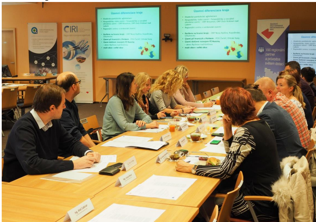
Obr. 3 Fotografie ze 13. zasedání RSK KHK