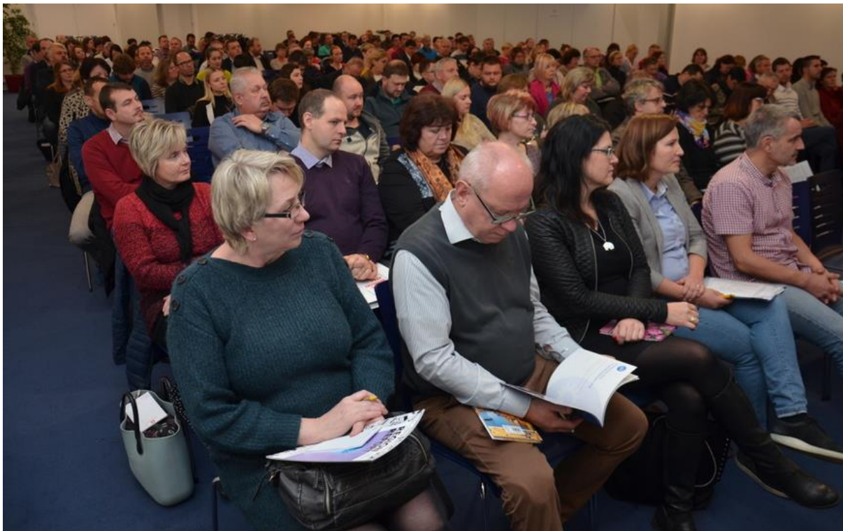
Obr. 12 Fotografie ze semináře Nové dotace pro obce na rok 2019 ze dne 5. prosince 2018