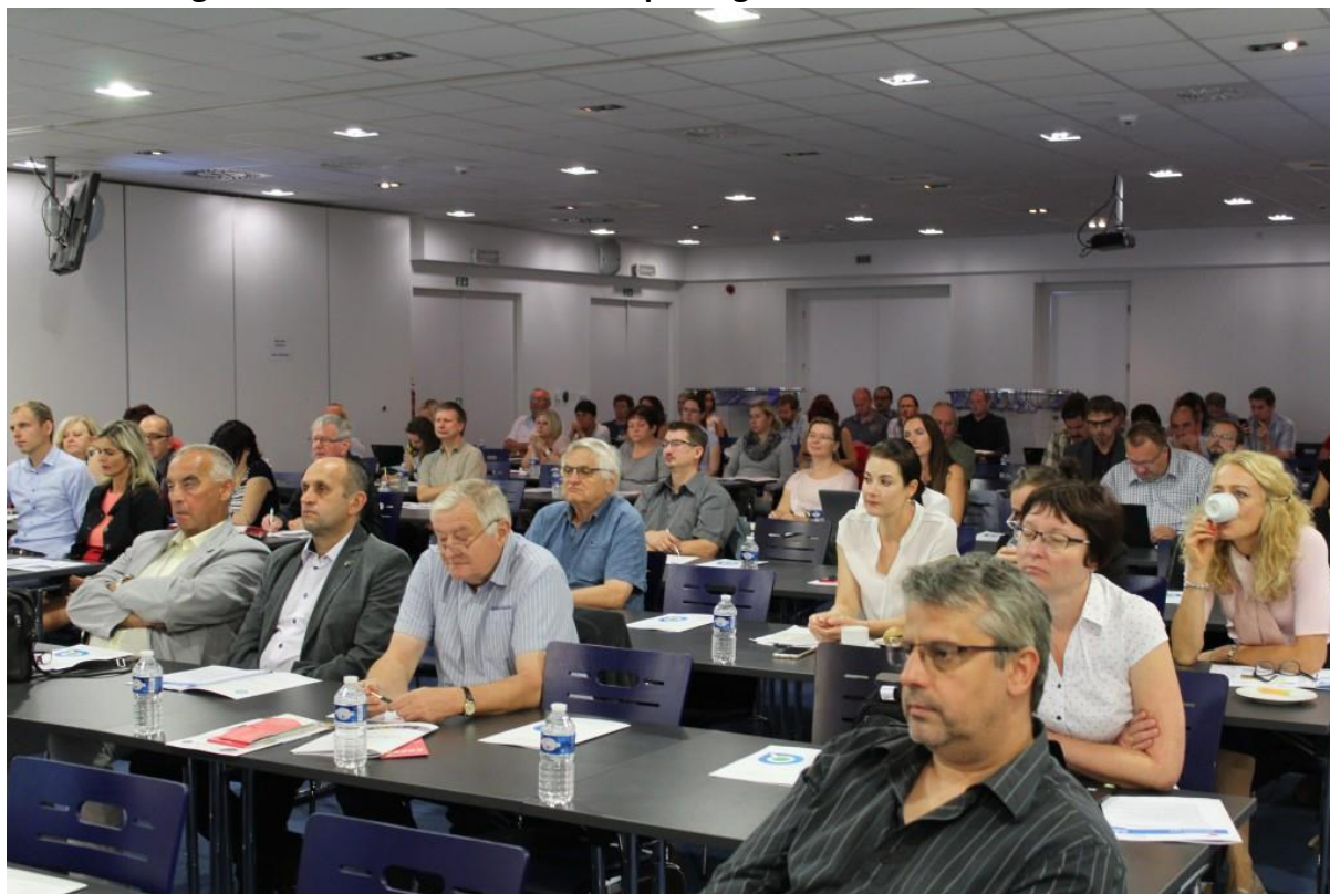
Obr. 11 Fotografie z konference Příležitosti pro region 2018

Výstupy z panelové diskuze byly 4. října 2018 prezentovány RSK KHK na jejím 13. zasedání.