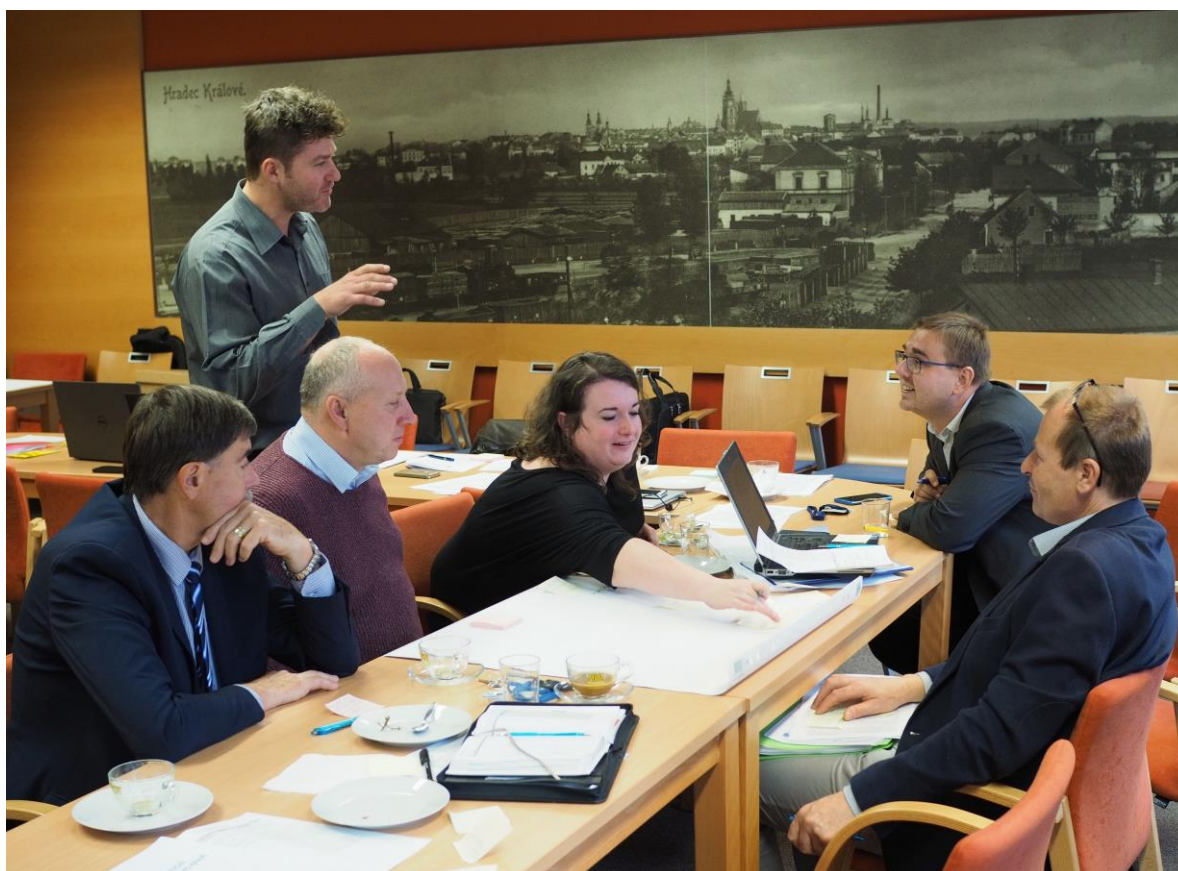
Kulatý stůl RSK KHK