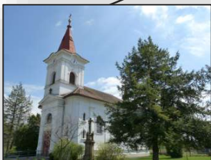
Kostel sv. Jana Křtitele