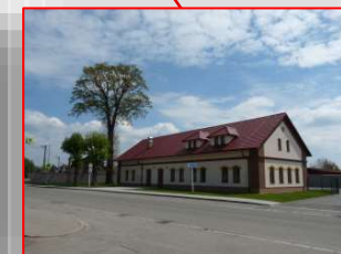
Nový obecní úřad Hasičská zbrojnice