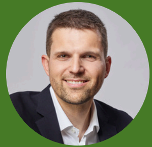
Petr Hladík ministr životního prostředí