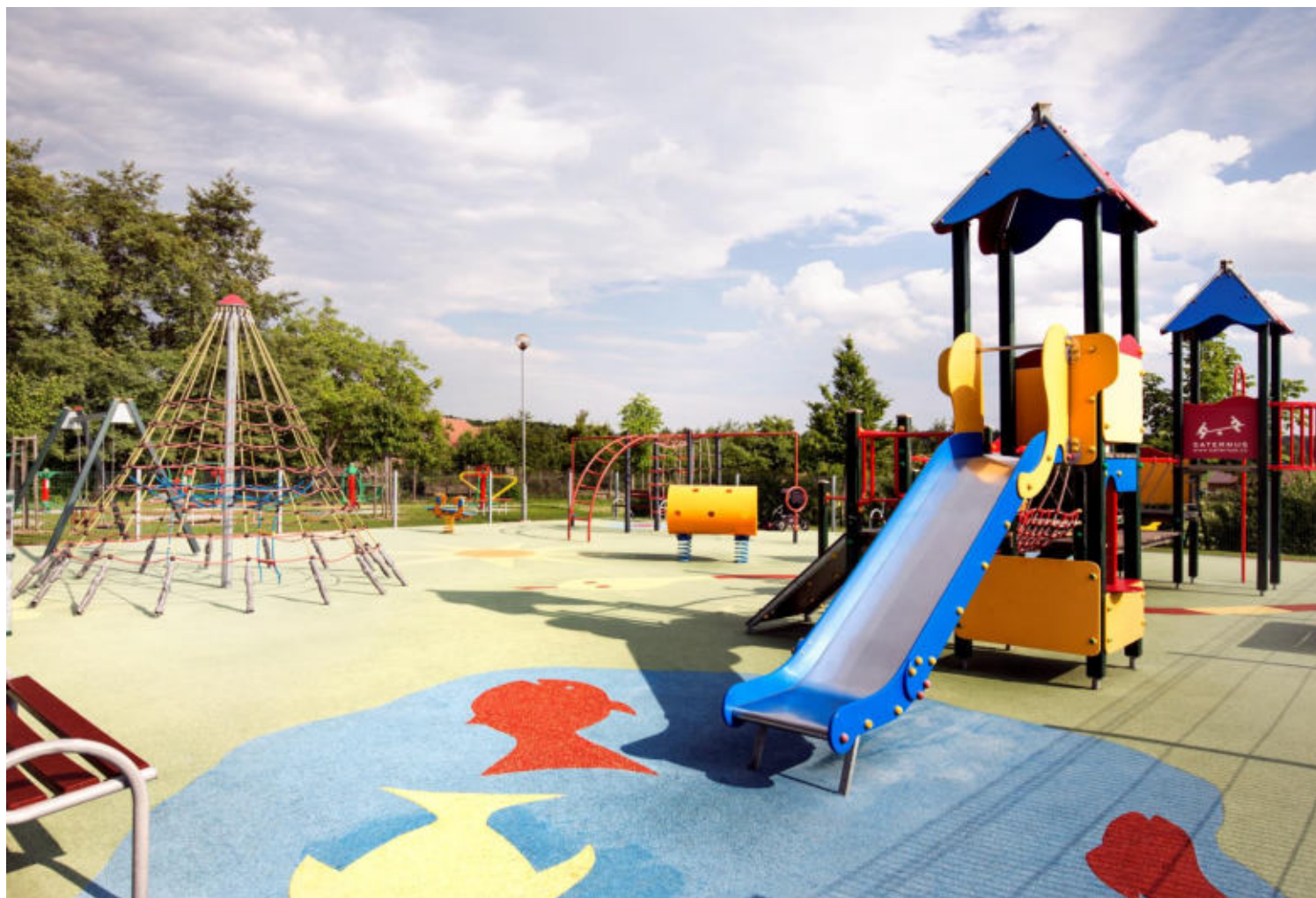
Dětské hřiště v Lodíně.