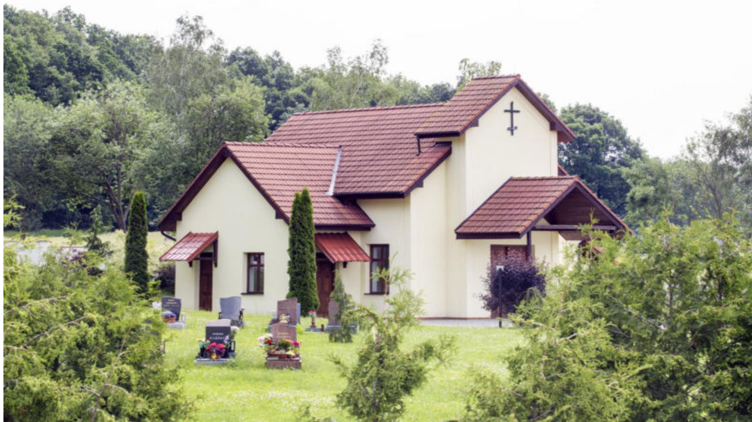
Nová rozlučková síň .