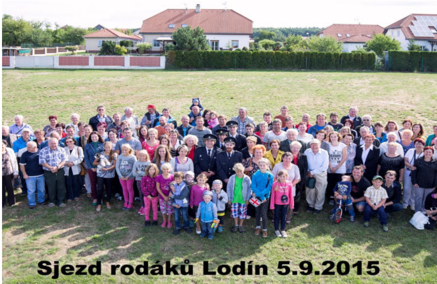
Sjezd rodáků Lodín 5.9.2015