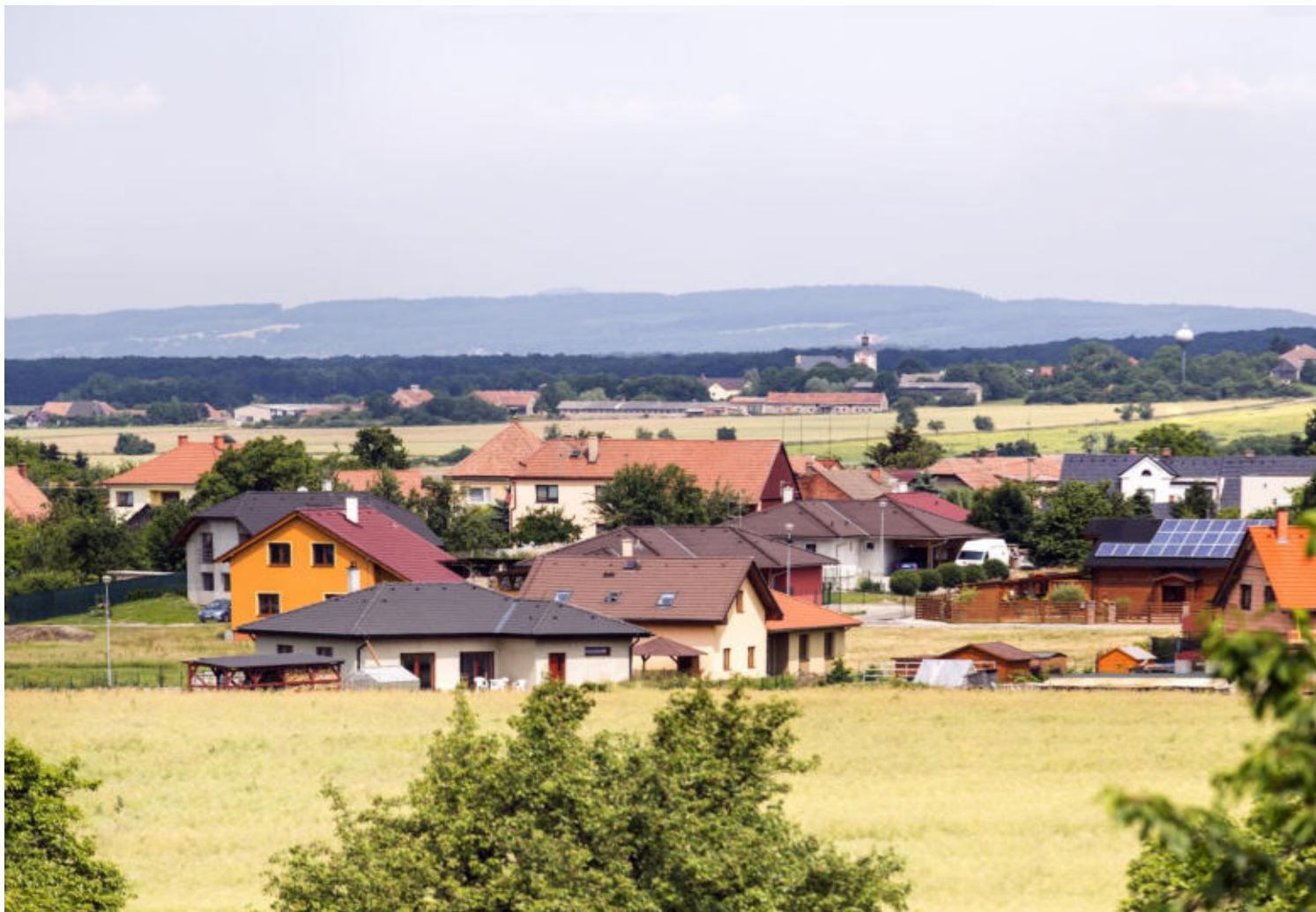
Pohled na Lodín od rozlučkové síně.