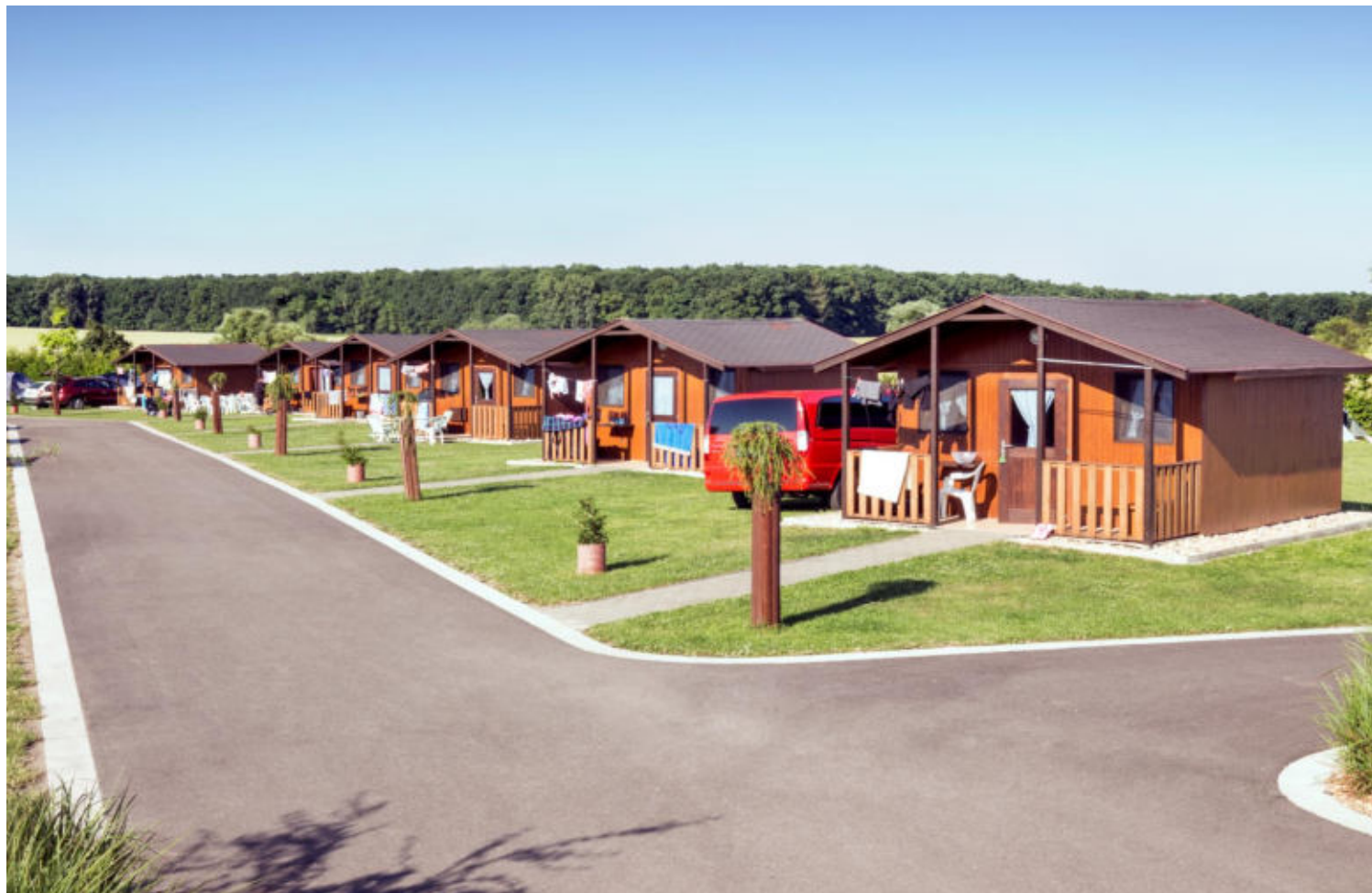
Autokemp v Lodíně.